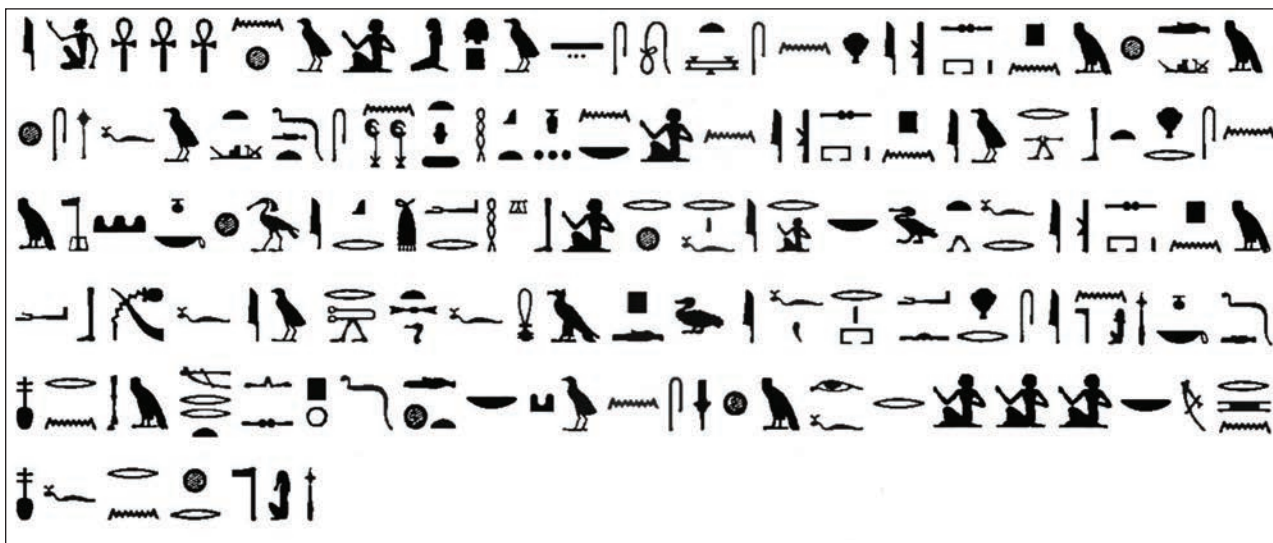
Slika 1: Prepis apela živim vklesanega nad vhodom grobnice Harhufa v Asuanu (prirejeno po Garnot, 1938, 63).

»O ye living who are upon earth, [who shall pass by this tomb whether] going down-stream or going up-stream, who shall say, »A thousand loaves, a thousand jars of beer for the owner of this tomb!« I will intercede for their sakes in the Nether World« (Breasted, 1912, 169).