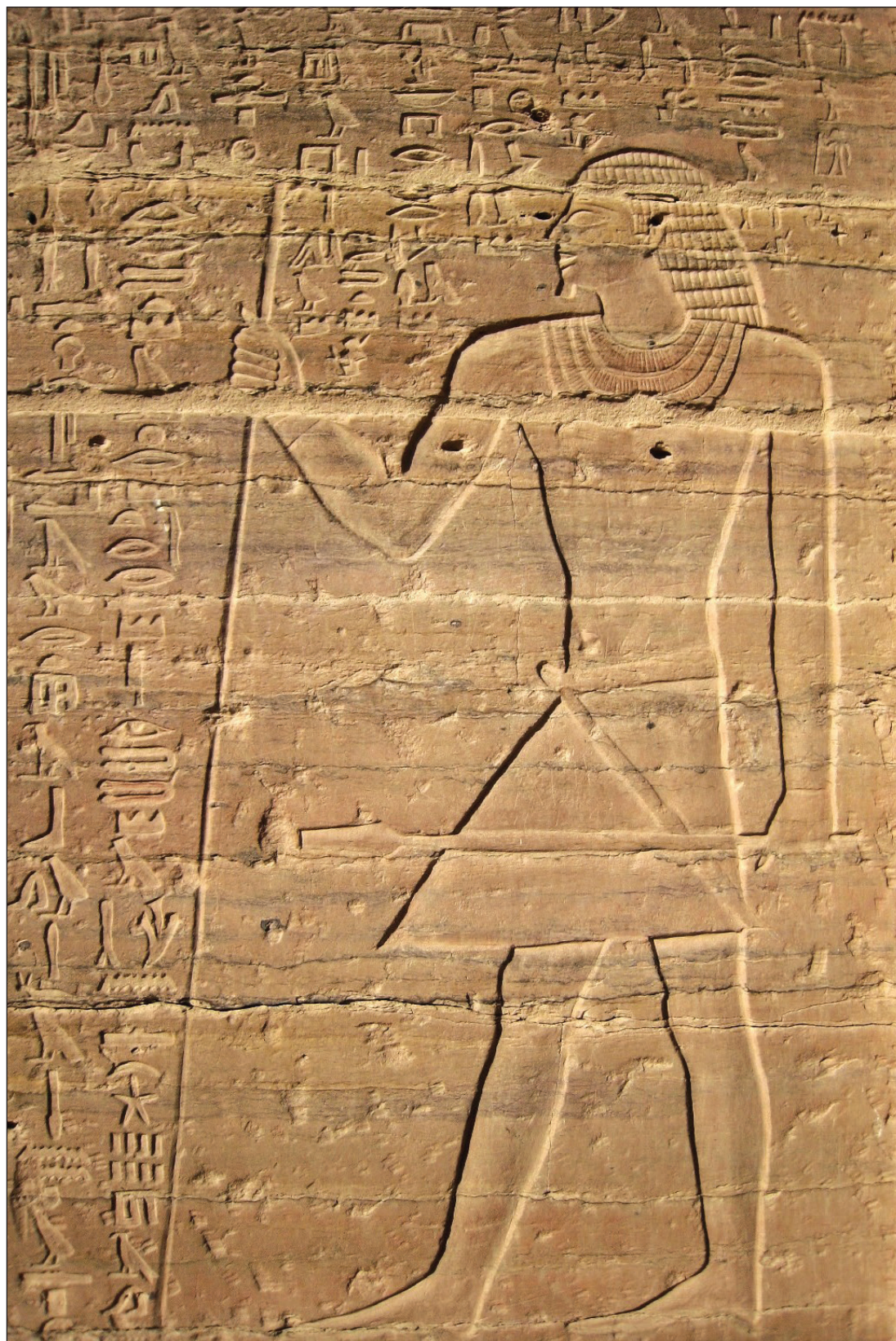
Slika 3: Relief s podobo Harhufa na fasadi njegove grobnice v Asuanu (Foto: Karen Green, CC BY-SA 2.0, Wikimedia Commons).