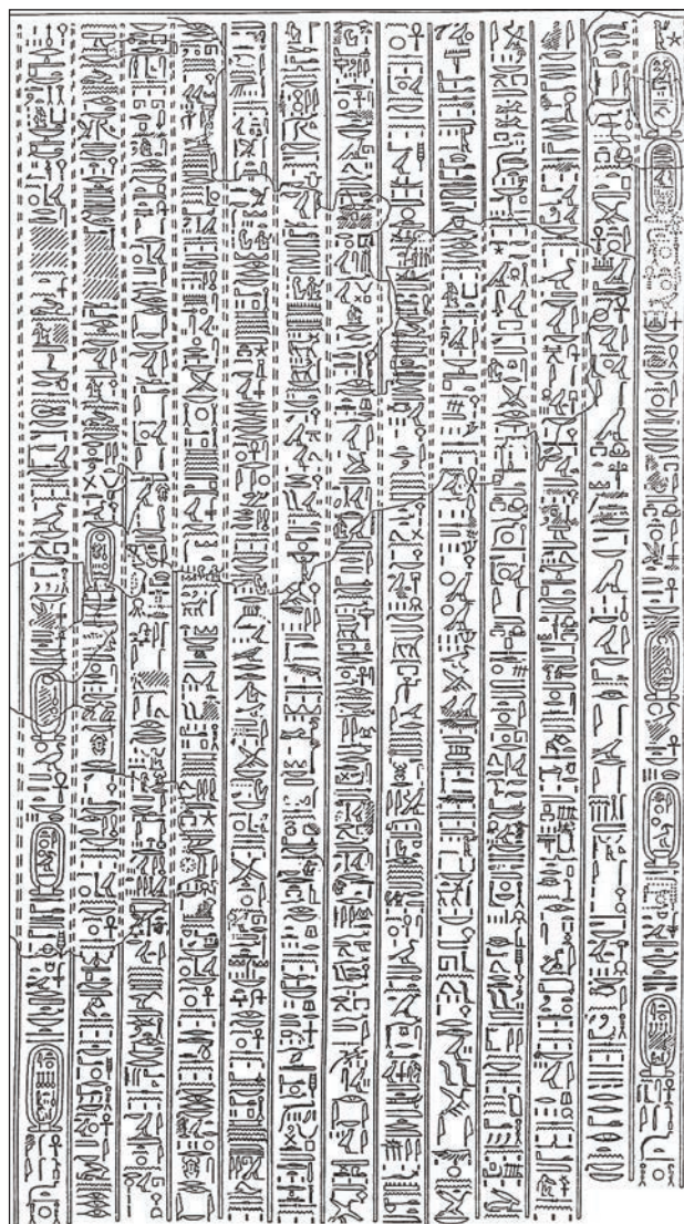
Slika 5: Epigrafska kopija Himne Atonu v Ajevi grobnici v južni nekropoli v Amarni (Davies, 1908, pl. XXVII).

Himno Atonu naj bi spesnil faraon Ehnaton; v njej je opisano vzhajanje in zahajanje sonca ter vpliv vzhajanja in zahajanja na vsa živa bitja, ki naj bi jih Aton kot bog stvarnik ustvaril. Vkllesana je bila na stene več grobnic v Amarni (Lichtheim, 2006b, 90). Najpopolnejša verzija je vklesana v 13 stolpcih na zahodni steni vhodnega hodnika (slika 5) v opuščeni in nedokončani Ajevi grobnici v Amarni – grobnica z oznako TA 25 (cf. Bouriant et al., 1903, pl. XVI; Davies, 1908, 18–19, 29–31; Lichtheim, 2006b, 96–100). Pod besedilom je izklesana še podoba klečečega Aja in njegove žene Tej, ki je bila dojlja kraljice Nefretete (slika 6). Na reliefih v njegovi grobnici je tudi motiv, ki upodablja faraona Ehnatona in njegovo ženo Nefretete, kako skupaj s hčerami z okna palače mečejo Aju in njegovi ženi Tej za nagrado zlat nakit (slika 7;