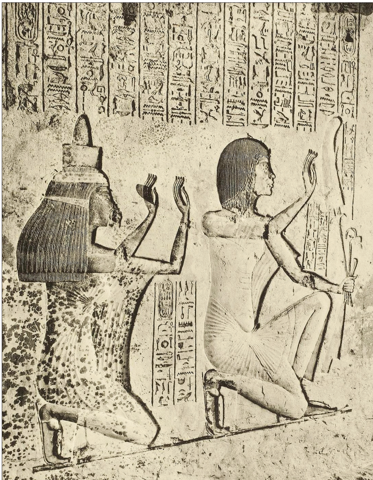
Slika 6: Klečeča Aj in njegova žena Tej v z dvignjenimi rokami v položaju čaščenja pod Himno Atonu, Ajeva grobnica v južni nekropoli v Amarni (Bouriant et al., 1903, pl. XVII).