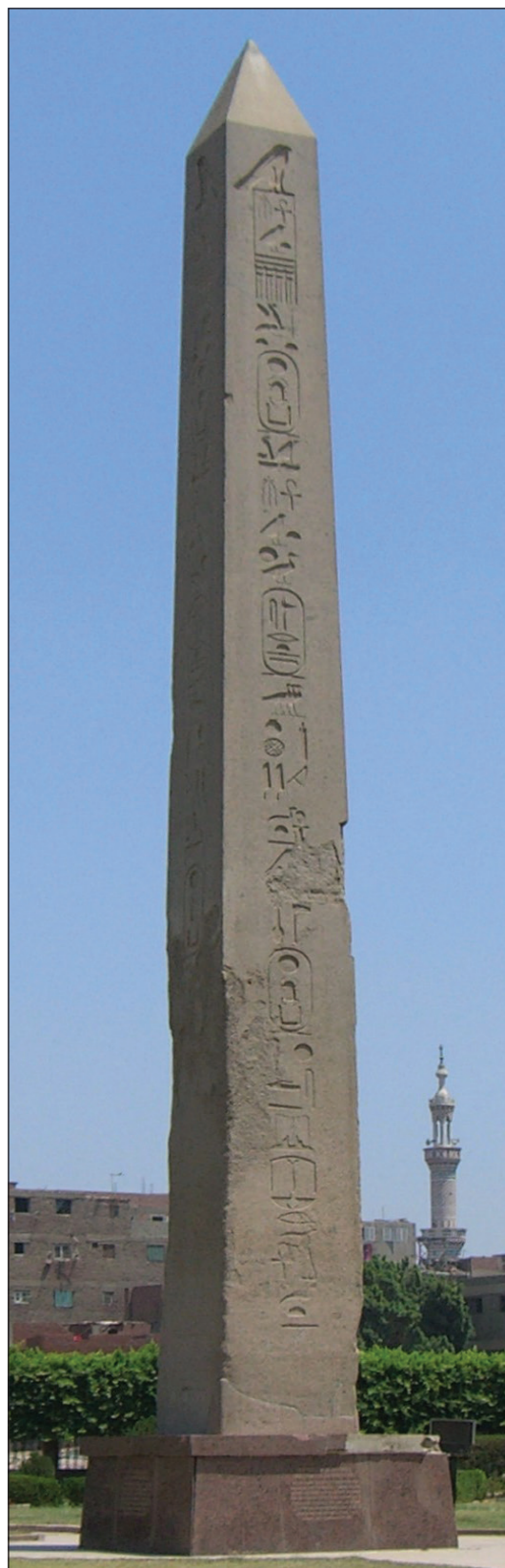
Slika 8: Obelisk faraona Senusreta I. v Heliopolisu.