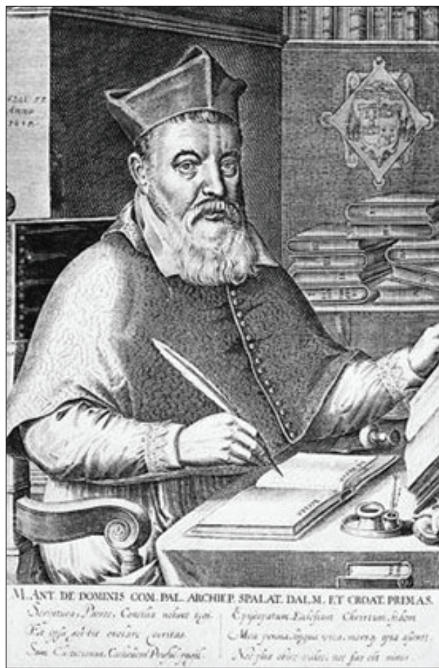
Slika 2: Markantun de Dominis.

istoriji Turaka ( General History of the Turks , 1603) u odjeljku o vladavini despota Đurđa Brankovića (Kostić, 1972, 351–352).